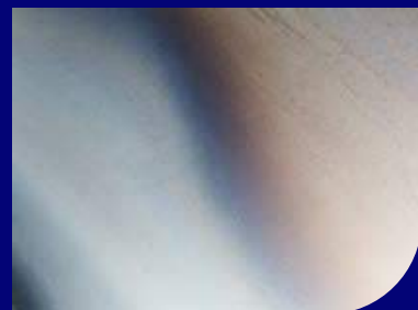
Detalhe do acabamento superficial Chapa Laminada a Quente

(*) massa específica indicada é 7,85 x 10 3 kg/m 3