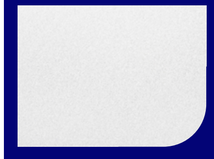
Detalhe do acabamento superficial Chapa Fina a Frio

(*) massa específica indicada é 7,85 \times 10^3 \text{ kg/m}^3